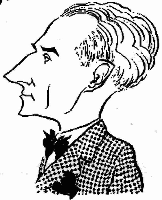
El segell discogràfic Naxos utilitza la caricatura al llibrets explicatius dels seus CD. Aquesta és de Maurice Ravel.

Aquest és el tipus de dibuix que hem dut a la nostra portada. Quan es compleix el desè aniversari d'una fita trista no hem volgut perdre el somriure.