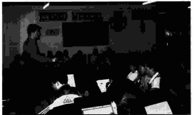
La banda juvenil durant un assaig.

En finalitzar el concert, l'organització va obsequiar els directores de la banda juvenil amb una placa d'agraïment.