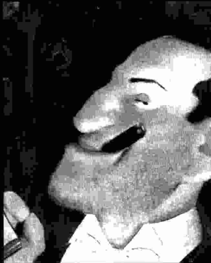
George Gershwin satisfet de l'èxit de Porgy and Bess. Autor: Will Cotton.