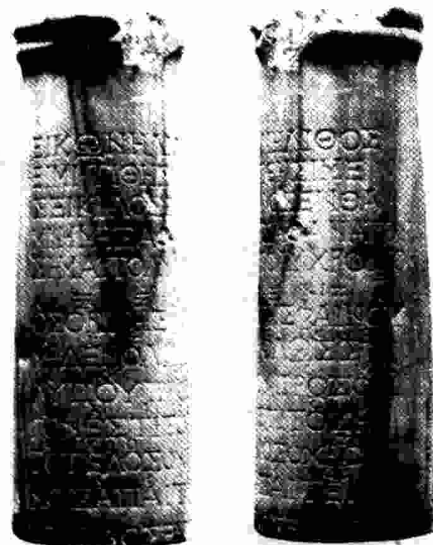
Estela de seikilos