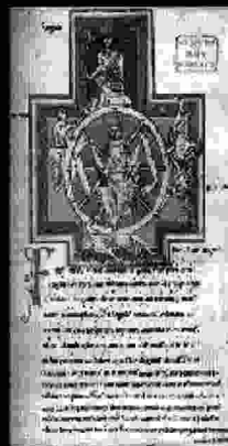
Manuscrit d'on va traure el text C. Orff

Carmina Burana està escrita al segle XX i es va estrenar el 1937 a Frankfurt. És freqüent en els compositors moderns l'evasionisme, que vol dir que es busca en altres èpoques, altres cultures o altres mons la temàtica de les seues obres. Moltes vegades aquests universos imaginaris s'idealitzen per no afrontar el moment actual. Cal recordar que el 1937 estava a les portes d'un dels successos més aterridors de la història de la humanitat: la II Guerra Mundial.