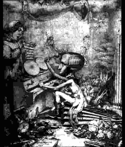
L'estada de Wagner a París fou un fracàs. Aquesta caricatura mostra les dificultats d'aquells dies. Autor: Kietz.