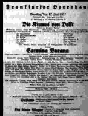
Programa de l'estrena a l'any 1937.

O, fortuna, Velut luna Statu variabilis, Semper crescis Aut decrescis; Nunc obdurat Et tunc curat Ludo mentis aciem, Egestatem, Potestatem Dissolvit ut glaciem.