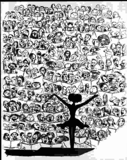
Hector Berlioz dirigint un concert en un jardí de París. L'autor caricaturitzava la monumentalitat de l'estil del compositor. Autor: Gustav Dore.