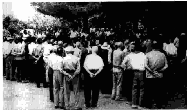
La Schola Cantorum va començar sent un Cor Masculí. La primera foto correspon a la seua participació al Concurs de Cors celebrat als Vivers de València, el 1959, on va guanyar el segon premi. La segona foto és una actuació de l'any 1960.