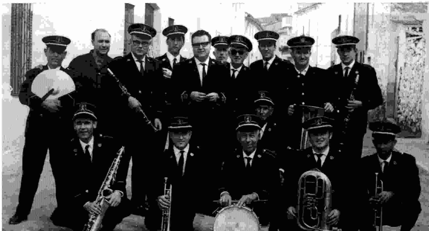
La banda a Algimia, el 21 d'octubre de 1967. Quin contrast aquesta formació (director i 15 músics) amb les actuals.