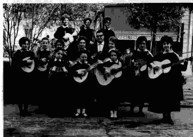
Tres imatges de la Tuna Parroquial Schola Cantorum. Presentada en públic l'any 1961, la rondalla és l'única secció de l'entitat que no ha superat el pas del temps. Va començar sent masculina, però les xiques s'hi van incorporar prompte.