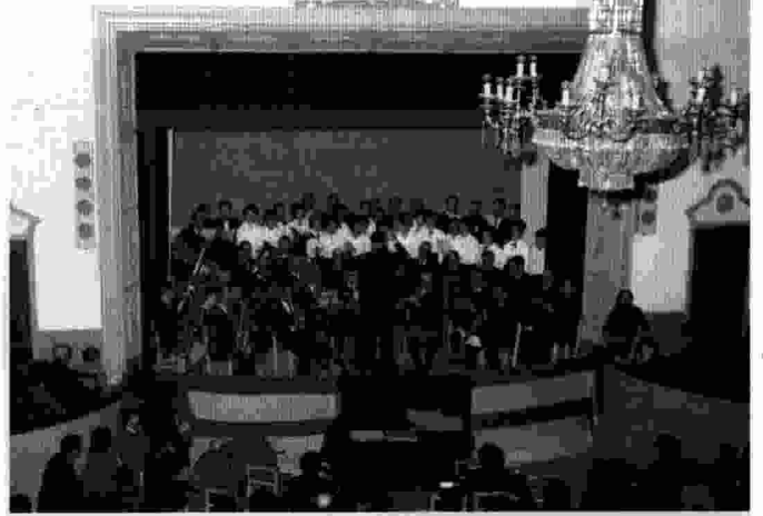
La banda de la Schola Cantorum es va presentar en públic el 24 de novembre de 1963, en la celebració de la festa de Santa Cecília. La foto pertany a aquella actuació.