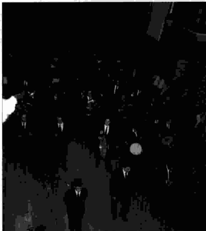
Tothom coincideix que la millor estampa de la banda desfilant és quan va pel carrer Nou. És un carrer llarg, ample i la formació de cinc columnes és perfecta. En la processó de Sant Vicent, la imatge encara és més bonica perquè la banda és molt nombrosa i els músics vesteixen l'uniforme complet.