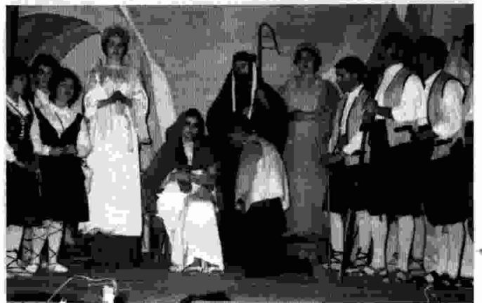
Durant uns anys la Schola Cantorum va celebrar el Nadal amb la representació d'Una estrella en el portal (coneguda popularment com El Betlem), obra de Pérez Solanas i Martínez Coll. A l'obra, que tenia, com una sarsuela, part dialogada i part musical, se li van afegir altres elements que feien les delícies del públic, especialment fragments filmats que es projectaven a l'escenari.