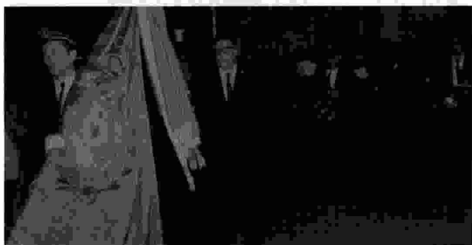
En la processó del Crist de l'any 1967, per esquivar els entrebancs de les autoritats locals, la banda va eixir desfilant des de dins de l'església de l'Assumpció. Les autoritats, que no volien que la Schola tocara, no es van atrevir a llançar la policia contra la processó.