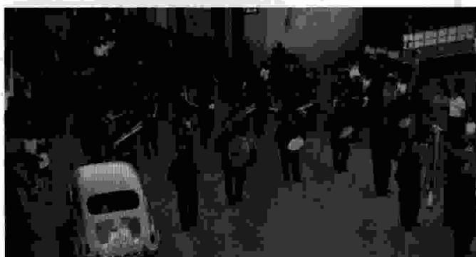
Comparem aquesta foto, corresponent a la processó del Cor de Jesús del 1968, amb la segona, de Sant Vicent del 2001.