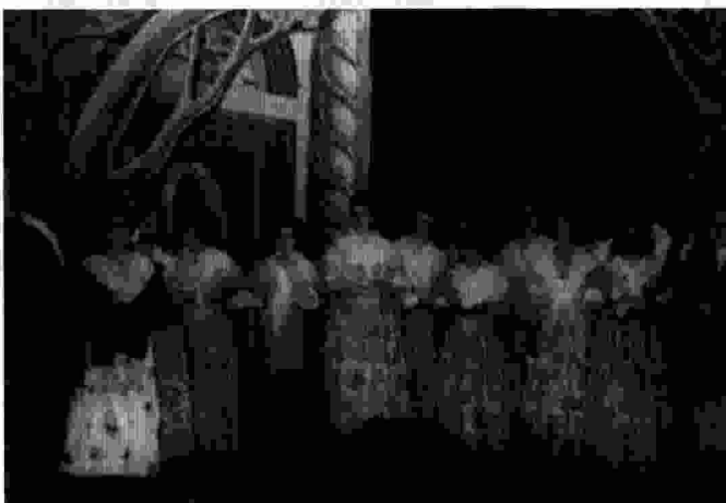
La alegría de la buerta és la primera sarsuela que va representar la Schola Cantorum, l'any 1956. La imatge pertany a aquell primer muntatge.