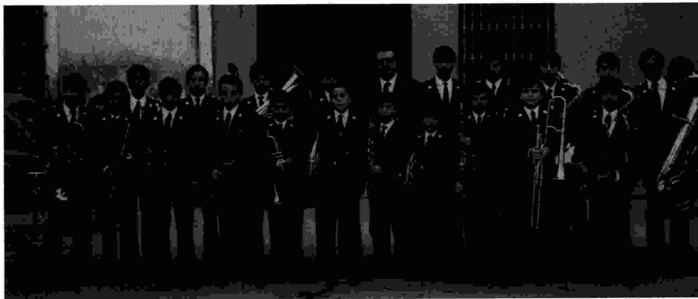
Foto de Santa Cecília de l'any 1972. Malgrat l'interès de don Miguel per formar una base sòlida de joves, en aquella època la Banda de l'Escola (o Banda Juvenil) no tenia una formació estable com ara.