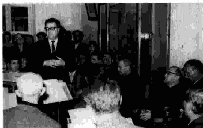
Una imatge de la inauguració de l'Hogar Parroquial, l'any 1968, en la seu actual.