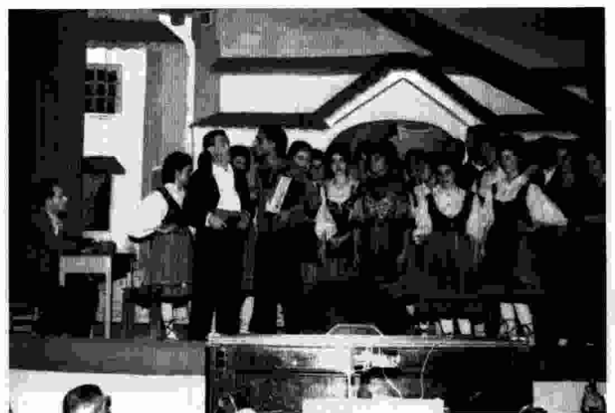
Una representació de La rosa del azafrán de l'any 1962. Aquesta sarsuela va ser una de les més representades per la Schola.