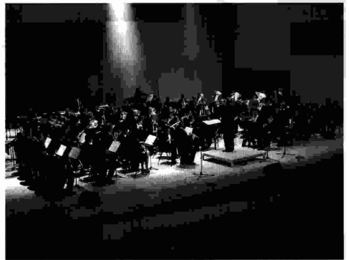
Concert a l'Auditori de Castelló.

El dia 19 de Desembre, endemà del concert de nadal, es fa fer el mateix programa al Auditori de Castelló. Esta va ser la primera vegada que la banda va actuar en l'Auditori amb molt d'èxit malgrat no haver massa assistència de públic.