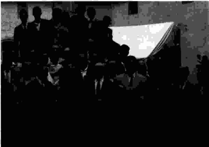
Podria ser la foto més antiga de l'entitat, presa el mateix dia 19 de març de 1955.