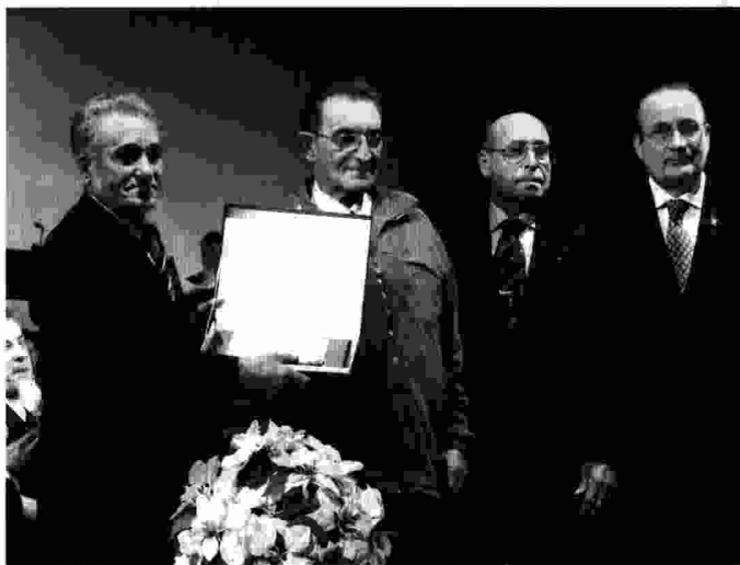
Els homenatjats recullen la placa durant el concert de nadal.

Abans de continuar amb el programa, es va fer un recés en el